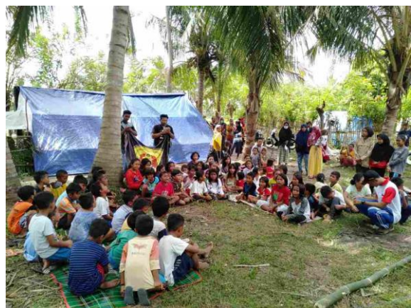
Kegiatan psikososial untuk anak-anak yang dilakukan Tim Rumah Bersama Relawan dan Tim UPNV Jakarta bersama UPNV Jatim di Desa Marana, Donggala