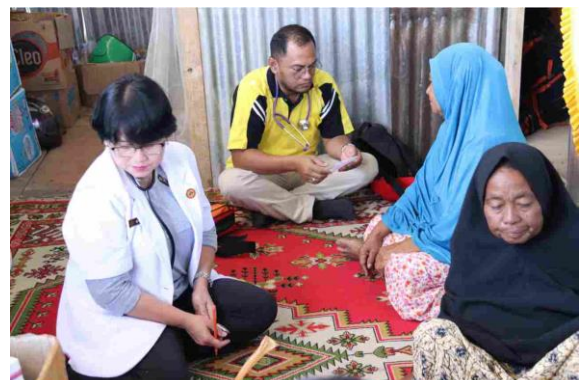
Kegiatan POS Kesehatan masyarakat yang dilakukan Tim Rumah Bersama Relawan dan Tim UPNV Jakarta bersama UPNV Jatim di Desa Petobo, Kota Palu