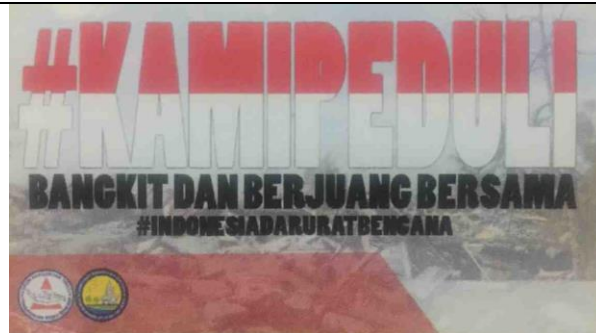
Gambar Stiker kami peduli yang dijual Mahasiswa Universitas Cenderawasih untuk korban Gempa dan Tsunami di Palu-Sigi-Donggala