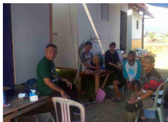
Partisipasi Tim UPNV Jakarta bersama UPNV Jatim dalam penyelesaian pembangunan huntara di Desa Sidera