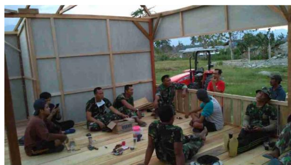
Kordinasi Tim Rumah Bersama Relawan dengan personil Marinir TNI dalam menyelesaikan huntara di Desa Sidera