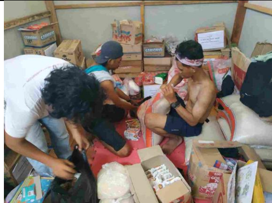
Kegiatan pembagian bantuan kepada warga di Desa Sidera