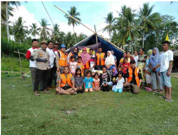
POS Kesehatan masyarakat yang dilakukan Tim Rumah Bersama Relawan dan Tim UPNV Jakarta bersama UPNV Jatim di Desa Marana, Donggala