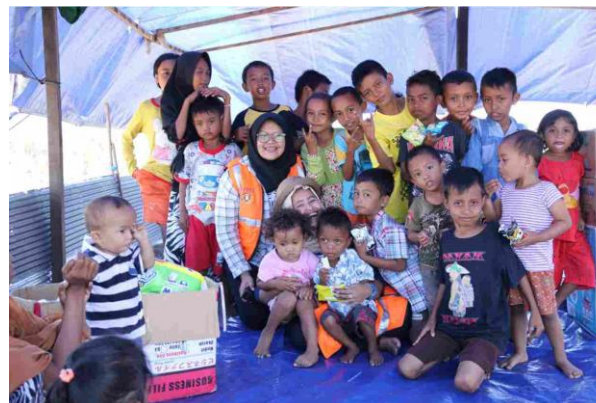
Kegiatan psikososial untuk anak – anak yang dilakukan Tim Rumah Bersama Relawan dan Tim UPNV Jakarta bersama UPNV Jatim di Desa Petobo, Kota Palu