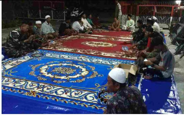
Partisipasi Tim UPNV Jakarta bersama UPNV Jatim dalam kegiatan yasinan dan do'a bersama di Desa Sidera