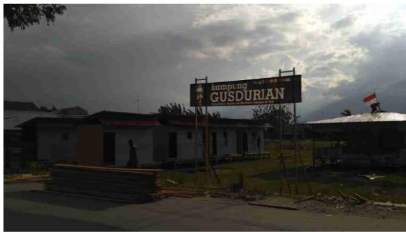
Pembangunan hunian sementara Kampung Gusdurian memasuki tahap akhir, 20 hunian, 1 mushola, 4 mck, 2 wc portabel dan 1 rumah baca telah selesai dibangun