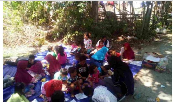
Kegiatan psikososial untuk anak – anak yang dilakukan Tim Rumah Bersama Relawan dan Tim UPNV Jakarta bersama UPNV Jatim di Desa Panau, Palu Utara