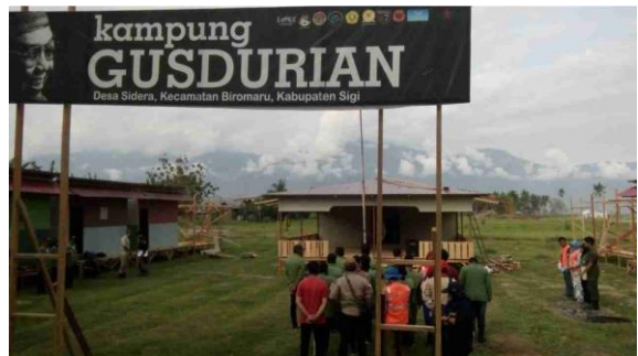
Upacara Bendera memperingati Hari Sumpah Pemuda bersama Tim Rumah Bersama Relawan, Tim UPNV Jakarta bersama UPNV Jatim, personil mariner TNI dan masyarakat Desa Sidera